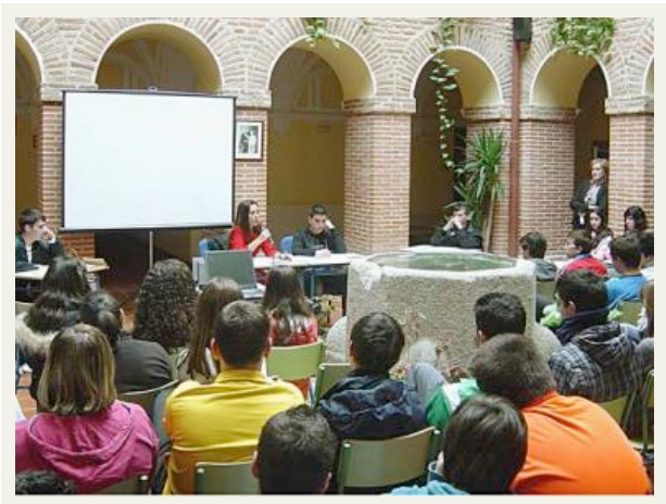
Alumnos del instituto de Fontiveros recrean un juicio en sus aulas.

Además, durante el próximo mes de mayo algunos alumnos del centro realizarán una estancia de una semana en el Centro de Educación Ambiental de Villardeciervos (Zamora) junto con un grupo de alumnos de Alcobendas (Madrid) y otro grupo participará en el programa de 'Rutas Literarias', que consiste en un viaje de una semana junto a alumnos de un centro de Manises (Valencia), recorriendo lugares relacionados con los 'Poetas del 27' en Andalucía.